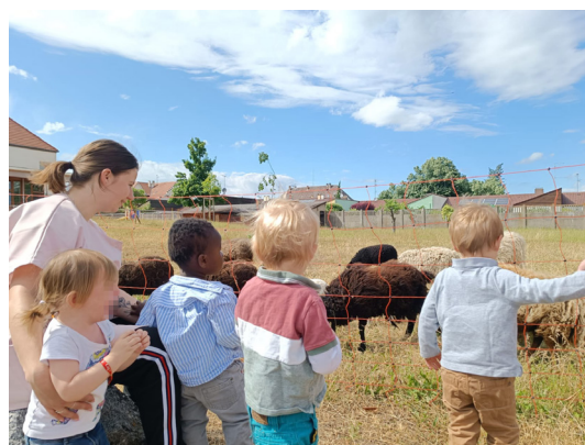
Dans le jardin des locaux de la pouponnière - MECS à Logelbach.

également au rajeunissement moyen du groupe. Le dernier groupe de MECS, la « Courte-Echelle », a connu un changement complet du groupe d'enfants. Les 11 enfants présents début 2025 ont été réorientés et le groupe termine l'année avec 11 nouveaux petits. L'équilibre de chacun, petits et grands, a dû être repensé, ce qui a permis de retravailler entièrement le projet de service afin de débiter l'année 2026 avec de bonnes résolutions !