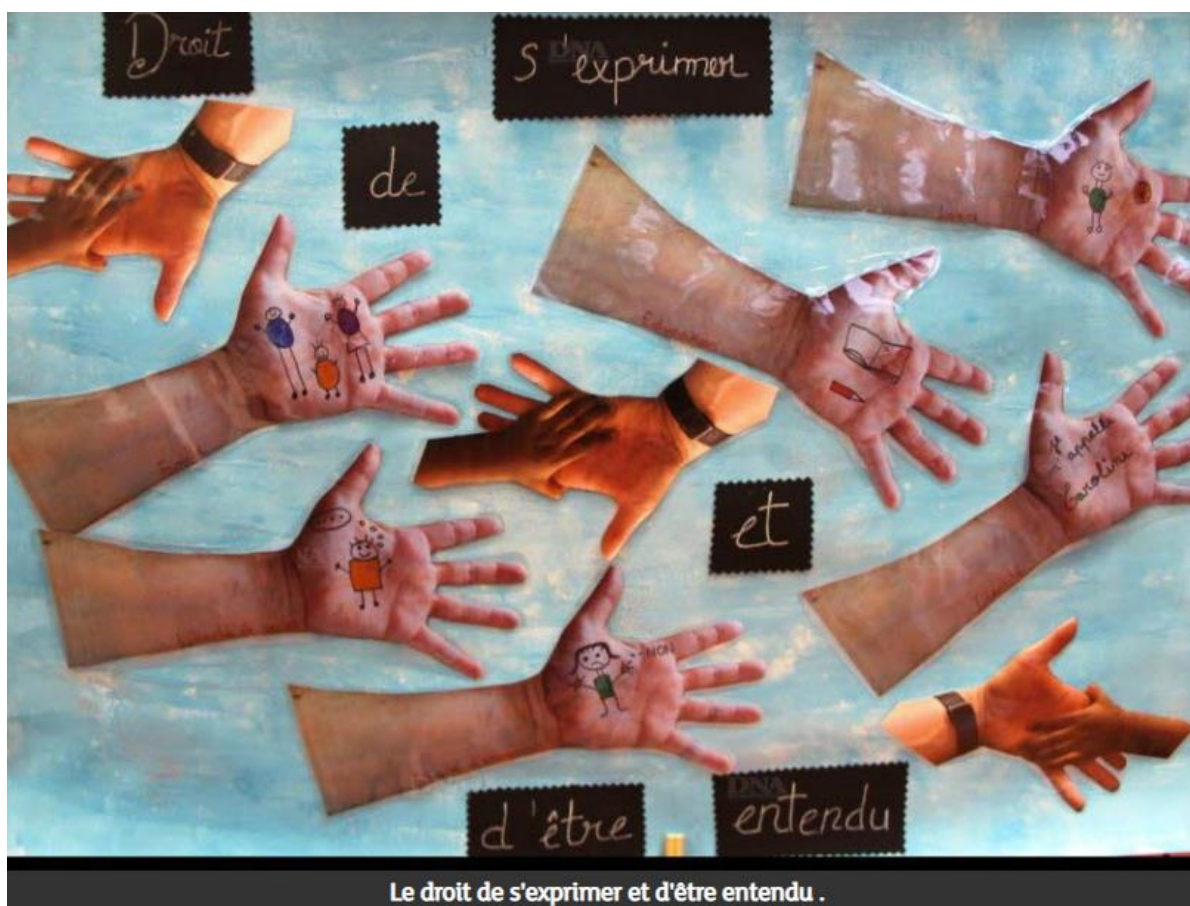
Le droit de s'exprimer et d'être entendu .