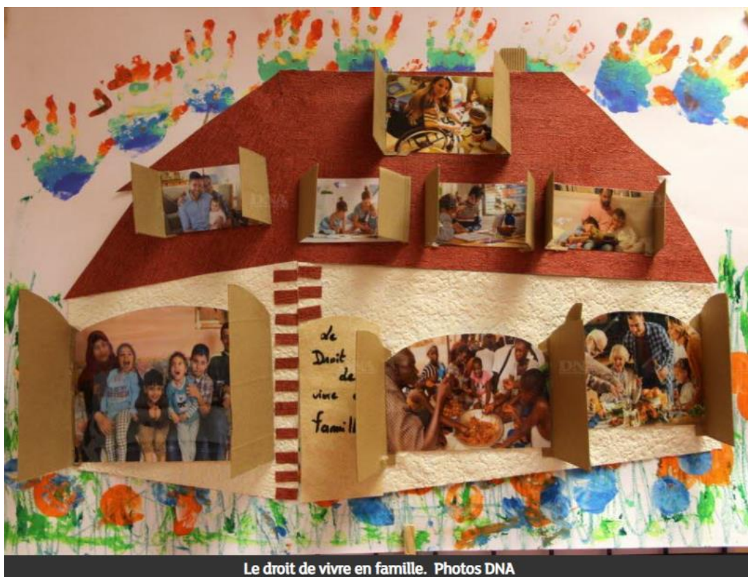
Le droit de vivre en famille.

Les équipes éducatives de chaque pôle de l'association Résonance de Logelbach ont été sollicitées, ce mardi 20 novembre, pour faire vivre le 30e anniversaire des droits de l'enfant au sein de leur établissement.